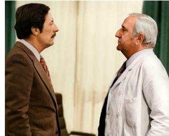
1974 LE FANTÔME DE LA LIBERTÉ de Luis Buñuel avec Jean Rochefort