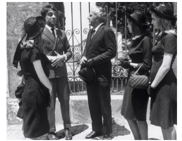
1964 UN MONSIEUR DE COMPAGNIE de Philippe de Broca avec Jean-Pierre Cassel