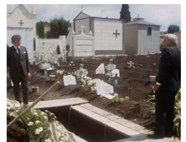
1970 LE TUNNEL DE LA PEUR (Fragment of Fear) de Richard C. Sarafian avec David Hemmings