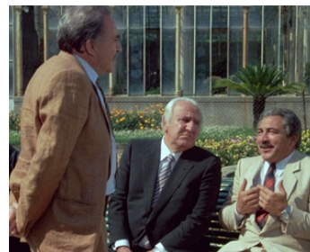
1982 MES CHERS AMIS 2 (Amici miei atto II) de M. Monicelli avec U. Tognazzi, G. Moschin