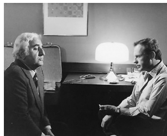
1977 LES PASSAGERS de Serge Leroy avec Jean-Louis Trintignant