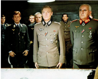
1973 LES 10 DERNIERS JOURS D'HITLER (Hitler: the last ten Days) d'E. De Concini avec S. Ward