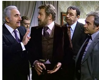
1975 MES CHERS AMIS (Amici miei) de M. Monicelli avec Gastone Moschin, Ph. Noiret, Ugo Tognazzi