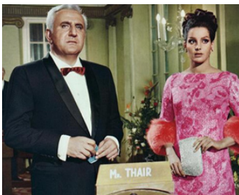
1967 OPÉRATION FRÈRE CADET (OK Connery) d'A. De Martino avec Agata Flori