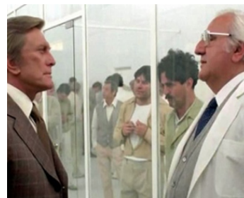
1977 HOLOCAUSTE 2000 (Holocaust 2000) d'Alberto De Martino avec Kirk Douglas