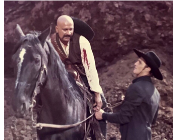
1965 YANKEE (Yankee) de Tinto Brass avec Philippe Leroy