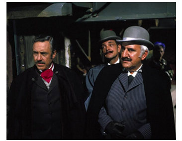
1971 DOUBLE ASSASSINAT DANS LA RUE MORGUE de Gordon Hessler avec J. Robards