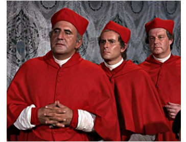
1965 L'EXTASE ET L'AGONIE (The Agony and the Ecstasy) de C. Reed avec Alec McCowen