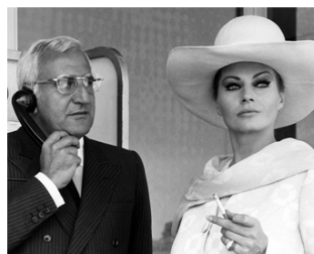
1969 LA MORT SONNE TOUJOURS DEUX FOIS d'Harald Philipp avec Anita Ekberg