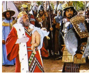
1970 BRANCALEONE AUX CROISADES (Brancalone alle crociate) de M. Monicelli avec V. Gassman