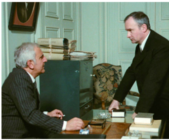
1970 UN CONDÉ d'Yves Boisset avec Michel Bouquet