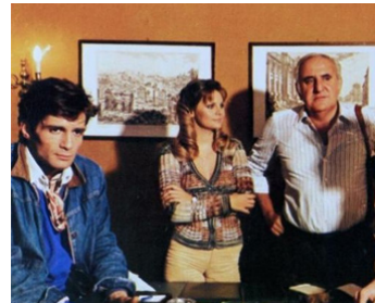
1976 DEUX FLICS À ABATTRE (Uomini si nasce poliziotti si muore) de R. Deodato avec M. Porel