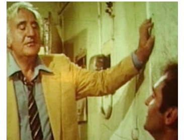
1976 L'HOMME SANS PITIÉ (Genova a mano armata) de M. Lanfranchi avec Howard Ross