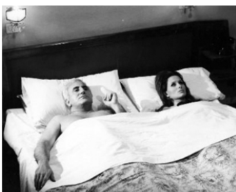
1969 MOI, EMMANUELLE (Io, Emmanuelle) de Cesare Canevari avec Erika Blanc