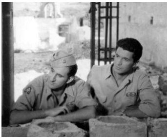
1945 UN AMÉRICAIN EN VACANCES de Luigi Zampa avec Luo Dale