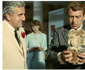
1963 L'HOMME DE RIO de Philippe de Broca avec Jean Servais