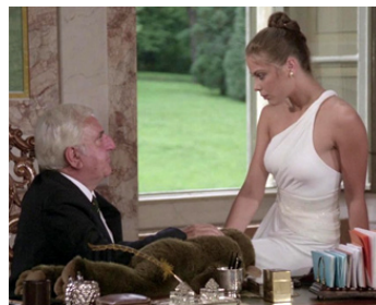
1981 AMOUREUX FOU (Innamorato pazzo) de Castellano & Moccia avec Ornella Muti