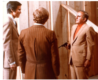
1970 L'EMPIRE DU CRIME (La mala dordina) de Fernando Di Leo avec Henry Silva