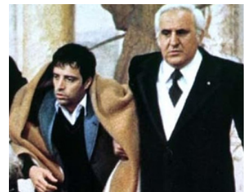
1978 LE BRAGHE DEL PADRONE de Flavio Mogherini avec Enrico Montesano