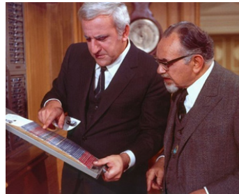
1967 LE CARNAVAL DES TRUANDS (Ad ogni costo) de G. Montaldo avec Edward G. Robinson