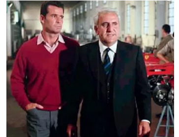
1966 GRAND PRIX de John Frankenheimer avec James Garner