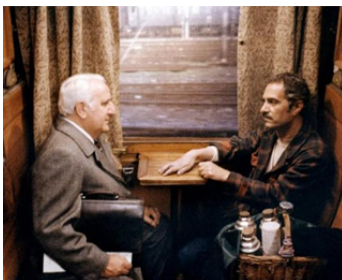
1980 CAFÉ EXPRESS (Café Express) de Nanni Loy avec Nino Manfredi