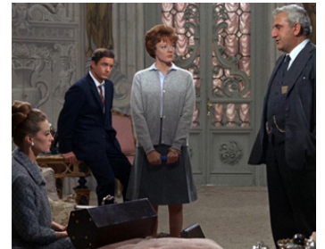
1967 GUÉPIER POUR 3 ABEILLES (The Honey Pot) de J. Mankiewicz avec C. Robertson, M. Smith