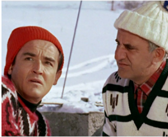
1965 SLALOM (Slalom) de Luciano Salce avec Vittorio Gassman