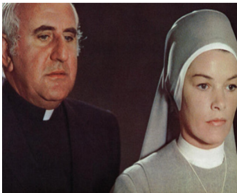
1974 LA TENTATION (Il sorriso del grande tentatore) de D. Damiani avec Glenda Jackson