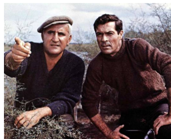
1967 LA GLOIRE DES CANAILLES (Dalle Ardenne all'inferno) d'A. De Martino avec Fr. Stafford