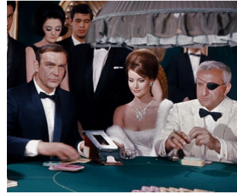
1965 OPÉRATION TONNERRE (Thunderball) de T. Young avec Sean Connery, Claudine Auger