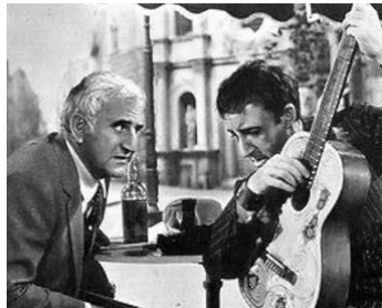
1967 TORERO MALGRÉ LUI (The Bobo) de Robert Parrish avec Peter Sellers