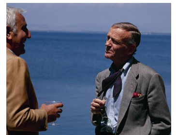
1969 LINGOTS À GOGO (Midas Run) d'Alf Kjellin avec Fred Astaire