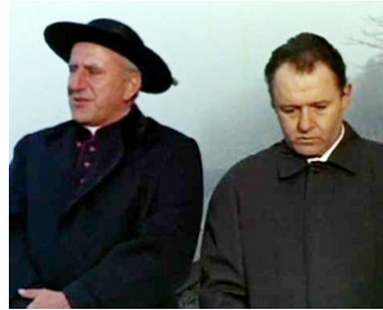
1965 UN HOMME EST VENU (E venne un uomo) d'Ermanno Olmi avec Rod Steiger