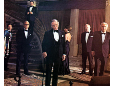
1974 DIX PETITS NÈGRES (Ten Little Indians) de P. Collinson avec H. Lom, R. Attenborough