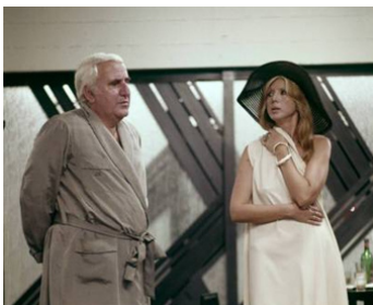
1977 CHE NOTTE QUELLA NOTTE ! de Ghigo De Chiara avec Enna Schurer